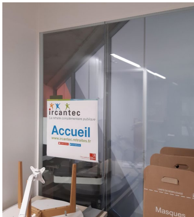
Photo 2 : Vue intérieure du vitrage (sur lequel est apposée l'affiche Accueil Ircantec) entre la salle d'accueil DSC (avec la sérigraphie) et le PCS