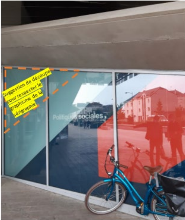
Photo 5 : Vue extérieure sérigraphie RDC Q2 (salle d'accueil DSC) avec suggestion de rogner légèrement en respectant la ligne graphique DPS

L'esthétisme de la sérigraphie serait ainsi préservé tout en permettant à la pièce de bénéficier de la lumière naturelle