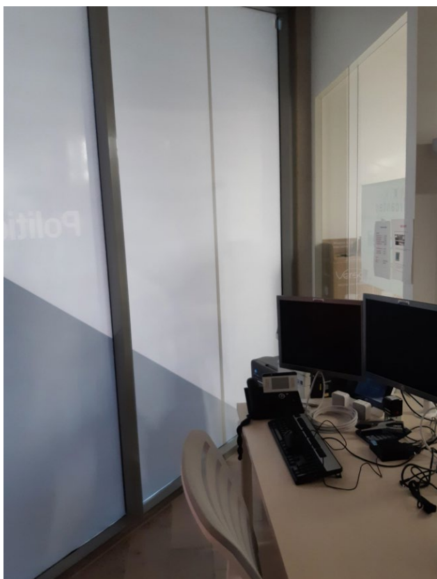
Photo 3 : Vue intérieure du bureau d'accueil DSC avec la sérigraphie extérieure derrière le poste de travail (pièce pouvant être considérée comme aveugle depuis la pose de la sérigraphie à faible transparence)